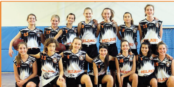
INIZIA LA FASE A ELIMINAZIONE DIRETTA PER LE UNDER 14

■ IN CLASSIFICA: Sanga ottavo per scontri diretti a sfavore con Geas B (entrambe 2 vinte-12 perse); campione regionale Geas A davanti a Costa e Vittuone