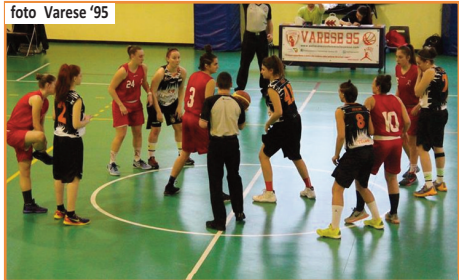
LE UNDER 18 IN CONTESA INIZIALE A VARESE