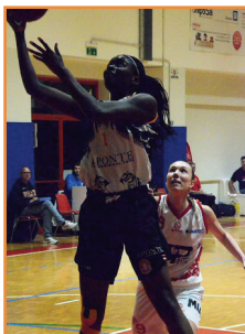
DA SILVA TROPPO IN ALTO PER LA DIFESA DI COSTA

SANGA: Da Silva 19 (7/11, 5/6 t.l.), Rossi 4, Pozzecco 14 (5/13), Rossini ne, Martellianno 6, Maffenini 11 (5/14), Baiardo, Ruisi ne, Albano 6, Picotti 2, Tibè, Galiano ne. All. Pinotti.